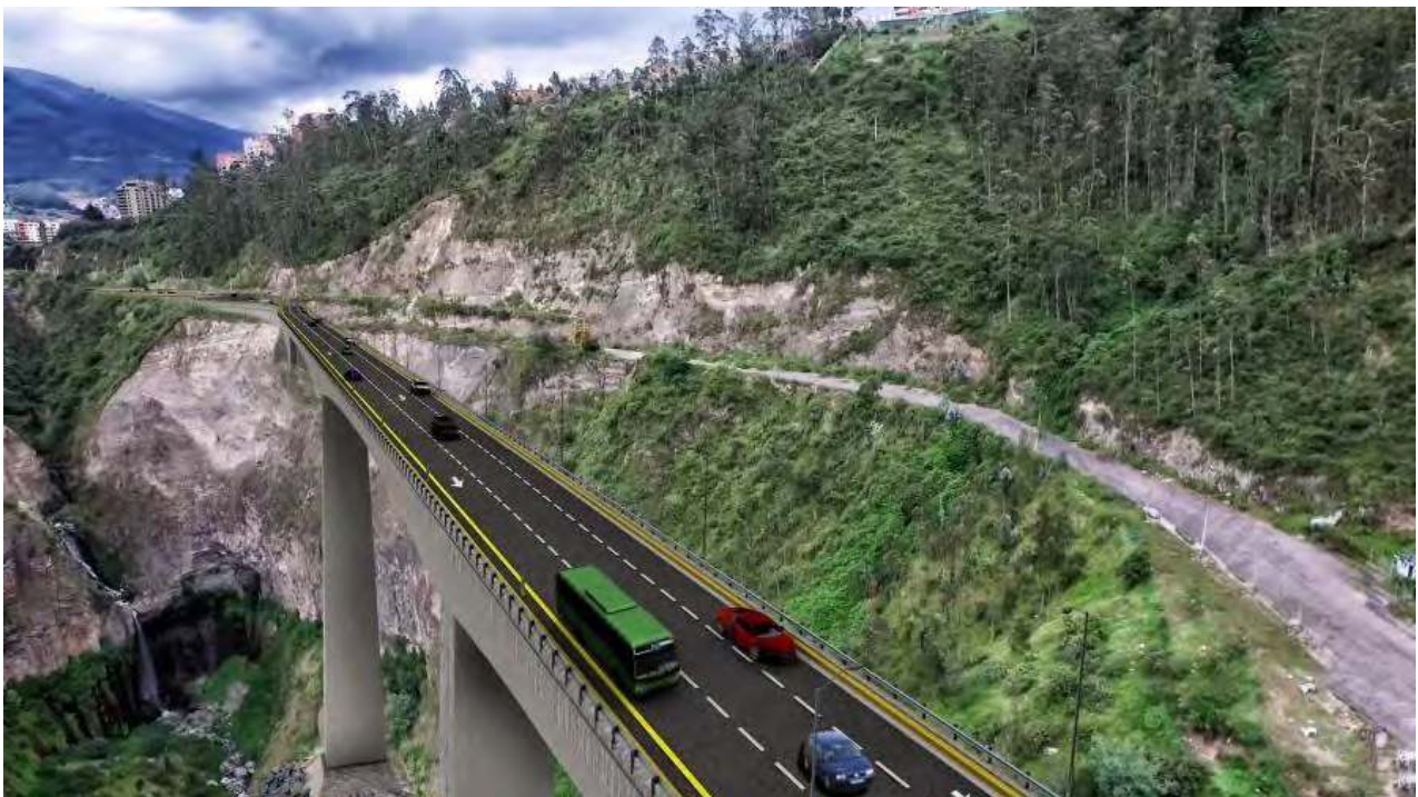
Foto: Render del puente de la Solución Vial Guayasamín

Nosotros fuimos electos para hacer obras, para resolver los problemas que antes no se habían resuelto y lo estamos haciendo. Bajo esta lógica se realizaron varios estudios, se analizaron diferentes propuestas y se lograron muy importantes para la ciudad. Así, gracias a la confianza de la inversión extranjera en Quito, en el Municipio, fue posible suscribir un contrato de alianza estratégica por 131 millones de dólares que permite la construcción de esta gran obra. Esto, indudablemente, también contribuye a dinamizar la economía, impulsar el desarrollo económico, generar los empleos que los quiteños requerimos. Esta obra beneficiará a una población aproximada de 300 mil personas que viven en los valles orientales de Quito y en la zona centro-norte del hipercentro de nuestra ciudad.