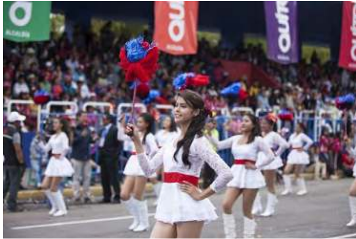
Foto: Pregón Fiestas de Quito en la Shyris

Estas fiestas registraron un saldo 'blanco': no se lamentaron accidentes de gravedad, hechos de violencia, heridos de seriedad. Sin duda, estamos avanzando al desarrollo de una cultura cívica, de respeto y de responsabilidad en nuestra ciudad. Festejamos a Quito con alegría, pero también cuidando nuestra seguridad, protegiéndonos, y eso a todos nos debe llenar de orgullo.