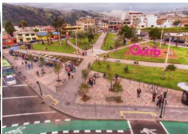
Foto: Transformación del Parque Navarro-La Floresta