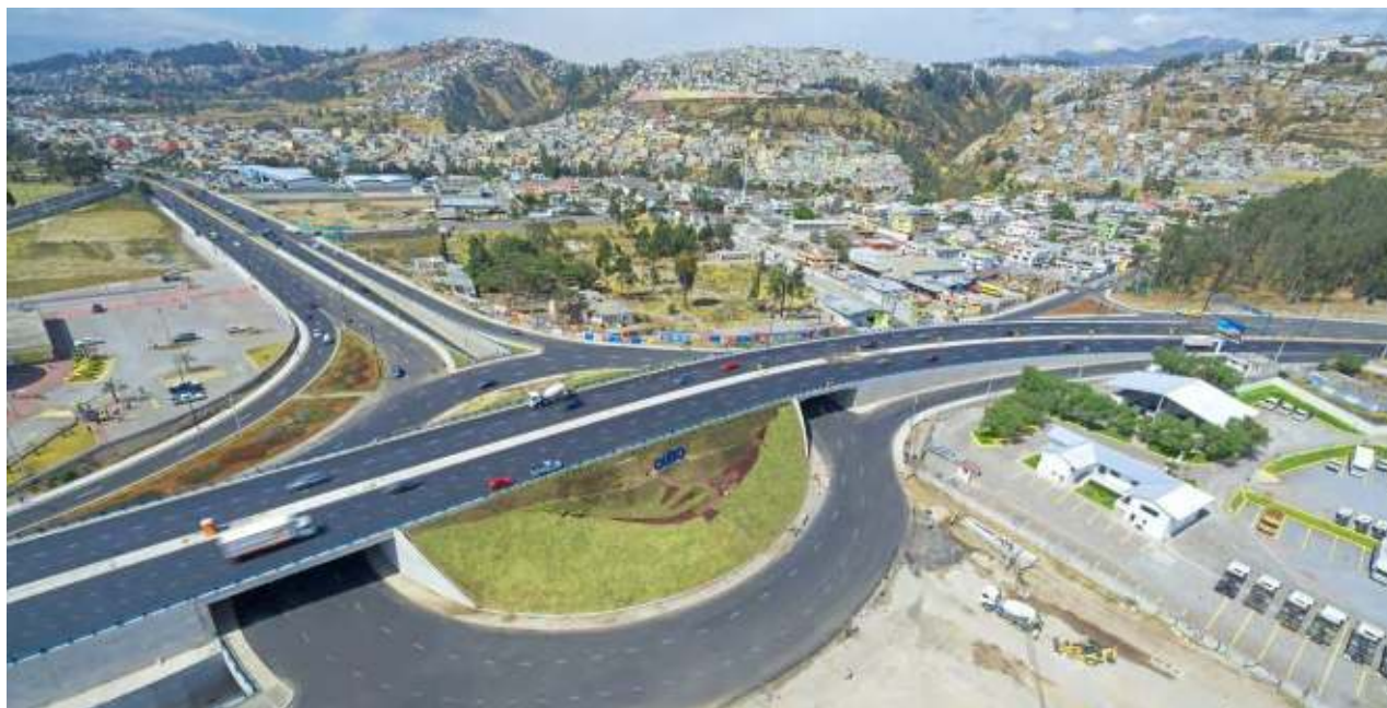
Foto: Intercambiador de Carapungo. Intersección Av. Panamericana Norte y Av. Simón Bolívar

Por cierto, con el nuevo Intercambiador de Carapungo y la fluidez que hoy existe, estamos también cambiando el rostro con el que nuestra ciudad recibe a propios y extraños. Es parte de construir una mejor imagen para el Distrito Metropolitano.