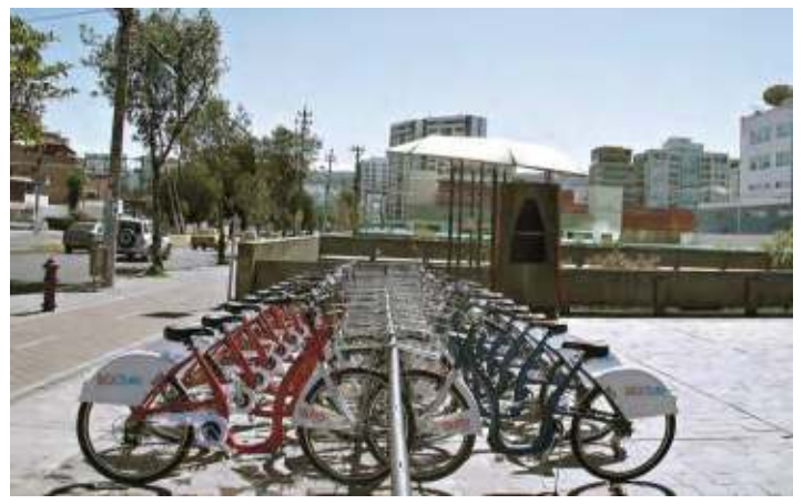
Foto: Estacionamiento para bicicletas

De igual forma, se ha consolidado la linda tradición de Quito como es el ciclo paseo dominical. Hemos creado también el ciclo paseo nocturno que se realiza los días jueves en la noche en el sector de La Mariscal, de tal manera que se genere una apropiación ciudadana del espacio público y se impulse el desarrollo económico y turístico en una zona tan importante como es La Mariscal.