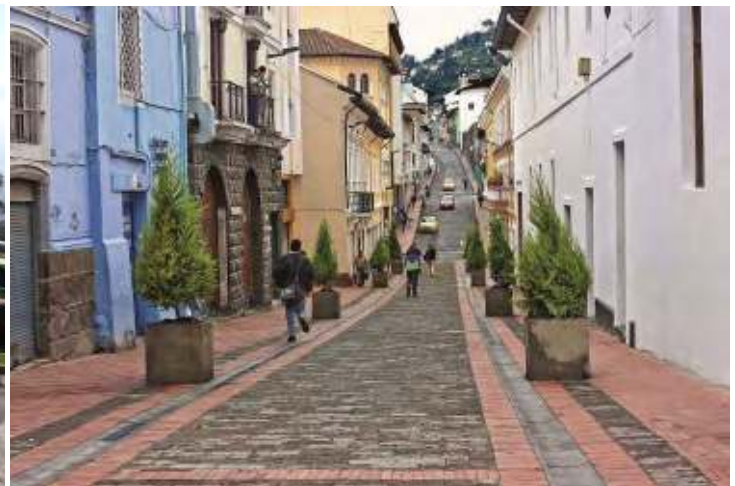
Foto: Bulevar Manabí

Así mismo, hemos peatonizado por completo calles Manabí, Flores, junto al Teatro Sucre, quitando terreno a los vehículos, brindando espacios para el paseo de las familias quiteñas, en este caso, por nuestro maravilloso Centro Histórico. Está también avanzando la obra de construcción del boulevard de la Av. Amazonas, que será la fachada del Parque Bicentenario. Esto una vez que concluyan los trabajos de renovación de la red de alcantarillado que estamos realizando en este momento en el sector.