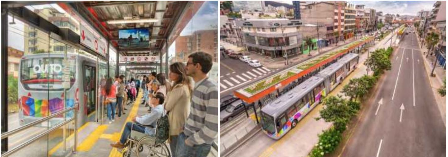
Foto: Estaciones del Trolebús inclusivas y amigales con el medio ambiente