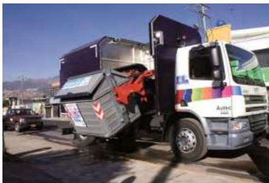
Fotos: Contenedores y camiones recolectores que se funcionan a lo largo del Distrito

La Ordenanza Metropolitana 332, de Gestión Integral De Residuos Sólidos del Distrito Metropolitano de Quito, sancionada el 16 de Marzo de 2011, determina las características que debe tener este sistema en la ciudad. La programación del servicio de recolección establece la atención, en la mayoría de sectores de la ciudad, con frecuencia interdiaria, en horarios diurnos, vespertinos o nocturnos, dependiendo la actividad y accesibilidad de los sectores a atender.