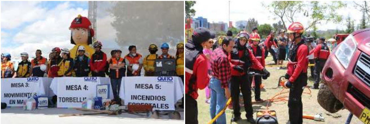
Fotos: Programa Quito Listo desarrolla acercamientos con la ciudadanía

De esta manera se priorizan los sectores que se intervienen cada año conforme a las competencias municipales. De igual forma, se brindan facilidades a sectores que por iniciativa buscan ser parte de los proyectos que lleva a cabo esta Secretaría General. Es importante tomar en cuenta que la vigilancia comunitaria por parte de la Policía Nacional no es una competencia del Municipio de Quito sino, del Ministerio del Interior.