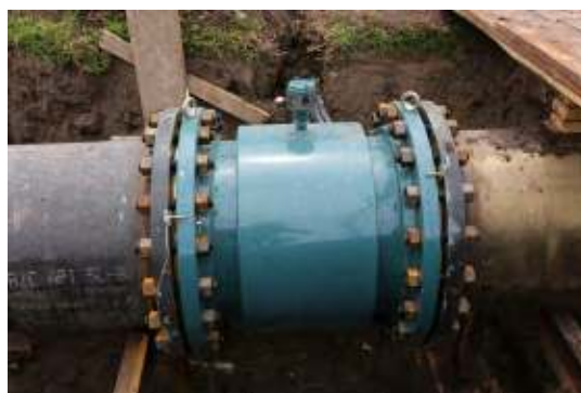
Foto: Alcantarillado y conexión de tuberías para proveer servicios de agua potable