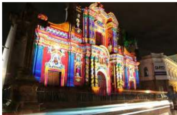
Fotos: Recorrido de ciudadanos en la Fiesta de la Luz, en el Centro Histórico. Iglesia de la Compañía

Esta fue organizada con un objetivo muy claro, no queríamos que Hábitat III se convierta en un evento reservado exclusivamente para los delegados, para quienes participaban en los seminarios, en las conferencias, en los paneles de discusión; queríamos que Hábitat III sea una fiesta para todos los quiteños, que todos los quiteños sientan que algo especial estaba pasando en la ciudad y, sin duda, eso se logró con la Fiesta de la Luz en la que participaron más de un millón y medio de quiteños, que nos tomamos las calles de nuestro Centro Histórico en familia, generando la reapropiación ciudadana de nuestro Centro Histórico. Quizás nunca antes el Centro Histórico había tenido semejante cantidad de ciudadanos. Gracias a Dios, esto ocurrió sin que exista ningún hecho que empañe una fiesta tan hermosa.