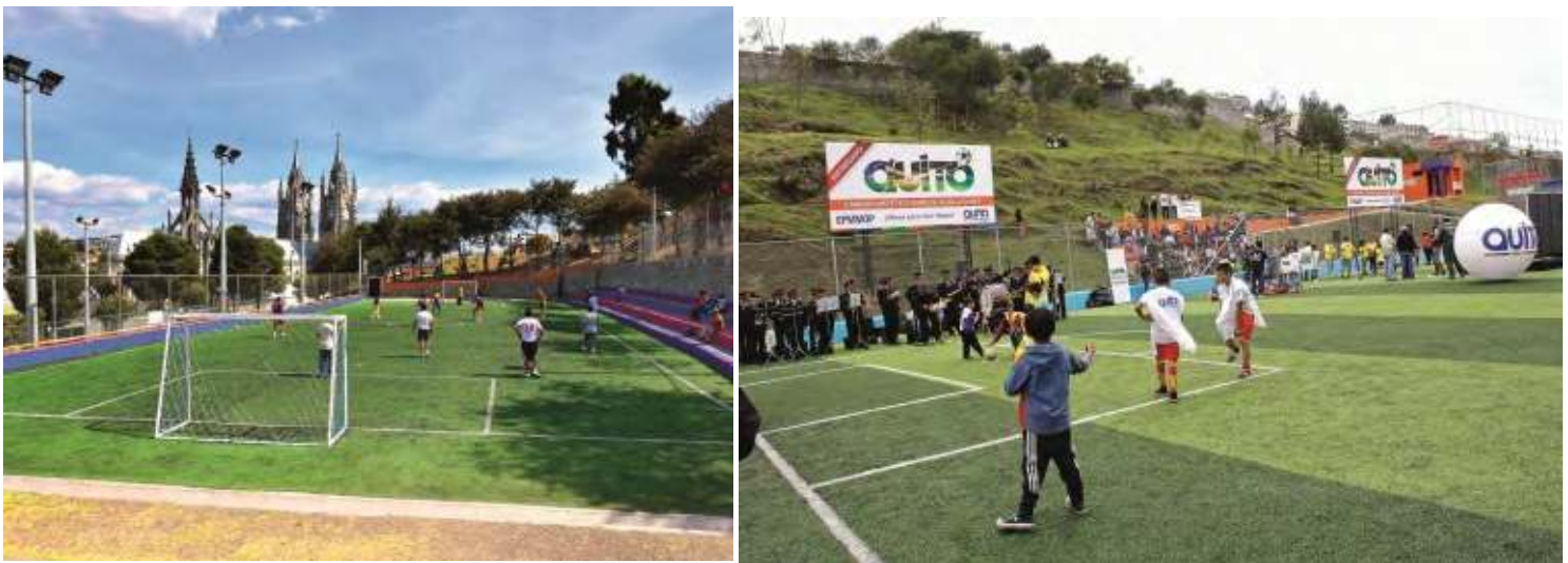
Fotos: Canchas Sintéticas en el Distrito Metropolitano

Los quiteños tenemos una profunda vocación deportiva y sobre todo futbolera. Cuando llegamos a la Alcaldía existían en la ciudad 8 canchas de fútbol sintéticas. Concluimos el 2016, en apenas dos años y medio de gestión, con más de 50 nuevas canchas de fútbol sintéticas.