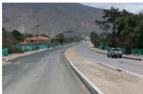
Foto: Prolongación Simón Bolívar

Este proyecto contempla 5 redondeles y dos puentes. Uno de ellos, el puente de Los Pájaros, está listo en su construcción, la cual se realizó con una tecnología muy avanzada. Con toda seguridad, va a transformar la movilidad del área noroccidental del Distrito Metropolitano de Quito.