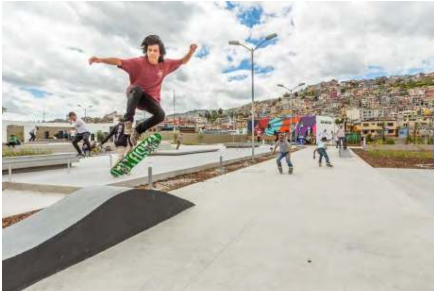
Foto: Parque Diversidades para actividades urbanas