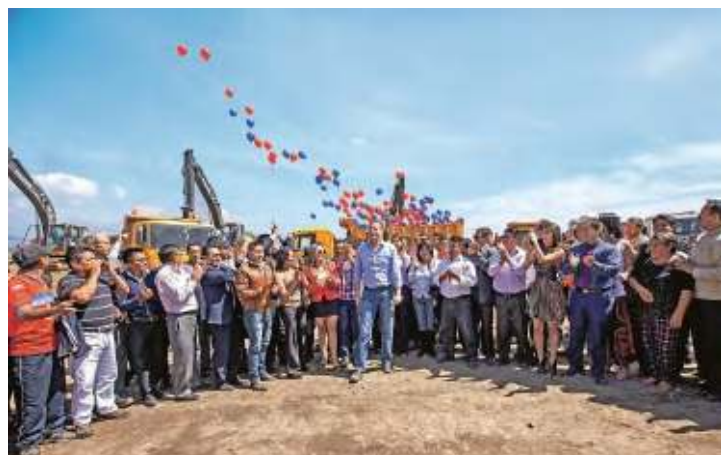
Fotos: Inicio de Obra en Quitumbe

El año 2016 ha sido clave para un proyecto que es el más importante en toda nuestra historia en materia de infraestructura pública: el Metro de Quito. Luego de que a finales del año 2015 suscribimos el contrato para la construcción del Metro de Quito, el 19 de enero del año 2016 arrancó esa obra monumental y emblemática.