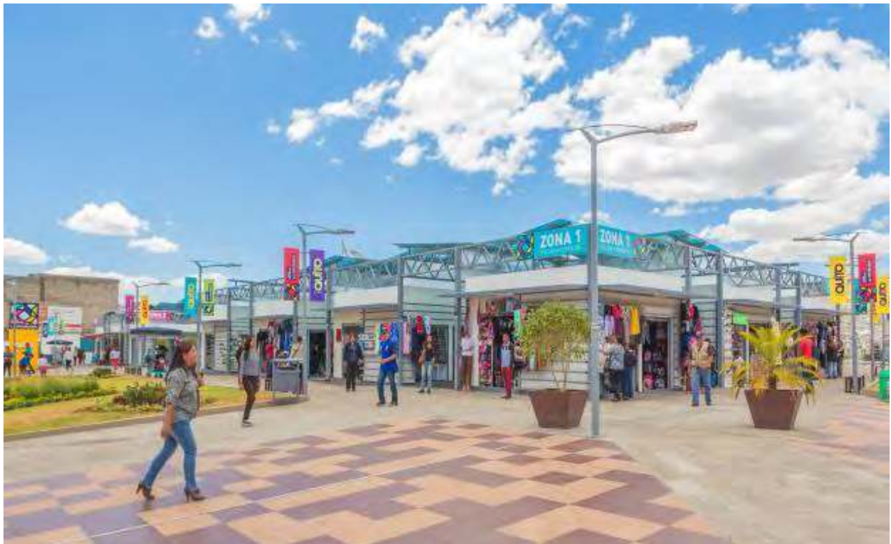
Fotos: Mercado La Michelena finalmente inauguramos en 2016, la Plaza Comercial La Michelena.

Algo similar ocurrió con la Plaza Comercial la Michelena. Cinco diferentes administraciones municipales fueron las que enfrentaron el desafío de resolver el problema del comercio informal en la Av. Michelena. Nosotros recibimos un proyecto que se había iniciado, pero que no cumplía con las condiciones adecuadas, al punto que los comerciantes lo habían rechazado. Iniciamos un proceso de diálogo con los comerciantes y gracias a la construcción de un consenso se hicieron modificaciones importantes en el proyecto que habíamos heredado y no solamente brinda condiciones adecuadas que lograron convencer a los comerciantes que se apostaban en la Av. La Michelena para que se reubiquen, sino que también representa un aporte al ornato de la zona, invitando a las familias quiteñas a pasear, a hacer sus compras en este moderno espacio. Ahora, la Av. Michelena luce ordenada. Hemos iniciado un proceso de renovación de la red de alcantarillado.