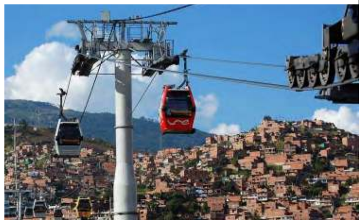
Foto: Transporte tipo teleférico en Medellín

Este tipo de sistemas, no sólo brindan transporte público de calidad, sino que traen consigo una regeneración, una transformación urbana integral. Así ocurrió en Medellín, Colombia, y también ya está ocurriendo en los barrios del noroccidente de Quito. Hemos emprendido trabajos viales en varias decenas de calles del sector, recuperado espacios públicos, y construyendo el nuevo parque Curiquingue. Hemos instalado nuevos contenedores de basura. Estamos recuperando pequeños parques del barrio, entre otras múltiples intervenciones urbanas que van a continuar durante el futuro, porque el objetivo no es solamente dar un sistema de transporte público de primera; es transformar la calidad de vida de los barrios históricamente aislados.