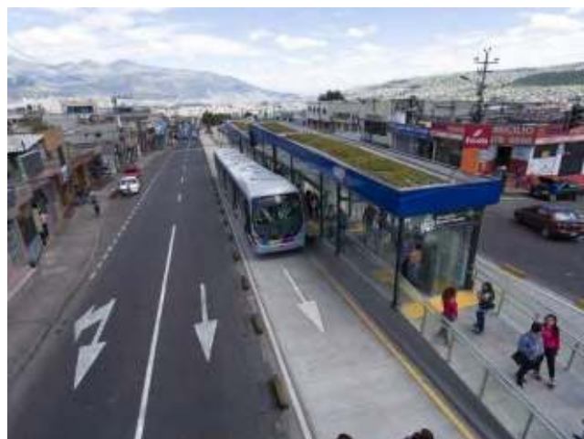
Foto: Estaciones Extensión Ecovía

Así mismo, al sistema integrado de transporte público lo complementa la Ecovía. Tenemos una gran noticia para la ciudad, y es que precisamente, el pasado 5 de diciembre de 2016, en homenaje a los 482 años de fundación de San Francisco de Quito, hemos inaugurado la extensión de la Ecovía al sur de la ciudad, desde el sector de Quitumbe hasta Guamaní. Estamos hablando de cerca de 4 kilómetros adicionales de recorrido, 5 nuevas estaciones que reúnen las mismas características de las estaciones del trolebús, para poder también recibir a los biarticulados con servicios modernos, servicios de primera, y también esta extensión de la Ecovía incluye una nueva Terminal que se ubica en la zona del antiguo peaje de Guamaní, en donde no solo se atienden unidades de la Ecovía sino también se genera conectividad con el transporte interparroquial e intercantonal.