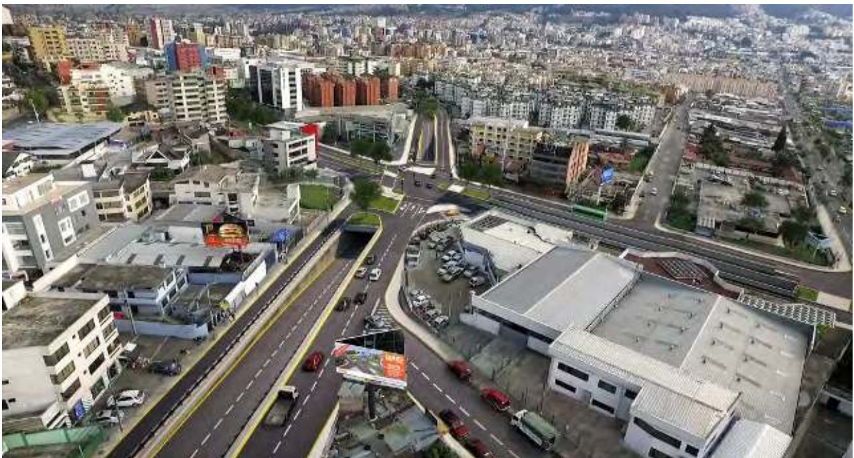
Foto: Intercambiador Granados

Otro acceso de la ciudad es el sector de la Av. Granados, Av. Eloy Alfaro y Río Coca. Está listo ese Intercambiador, cuya construcción inició en el 2016. Su objetivo es la disminución del tráfico que durante años afectó, no sólo a quienes residen en ese sector, sino a miles de quiteños que día a día vienen desde los valles orientales. Con el nuevo Intercambiador de la Av. Granados, Av. Eloy Alfaro y Río Coca también damos facilidades para una circulación más ágil del transporte público y de los vehículos particulares. Este Intercambiador tiene 10 rampas, incluyendo los 3 pasos deprimidos.