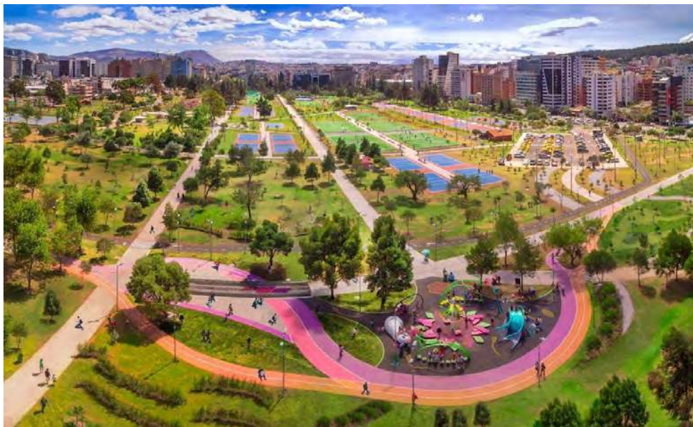
Fotos: Bulevar La Quebrada, parte de la modernización de La Carolina

El Parque La Carolina se construyó para representar un espacio amplio de convivencia ciudadana para los quiteños y se lo postergó hace varias décadas. Con el pasar de los años fue evolucionando y se convirtió en el parque más visitado por los quiteños, pero su infraestructura en los últimos años estaba bastante deteriorada y requería una intervención profunda e integral. En virtud de la importancia de este parque, para el Distrito Metropolitano de Quito ha sido un gran esfuerzo de inversión económica para convertirlo en lo que hoy es: uno de los parques más bellos y con mejor infraestructura de América Latina, porque eso es lo que nos merecemos los quiteños.