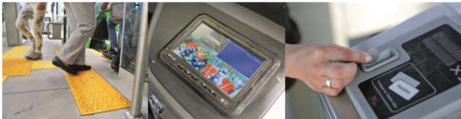
Fotos: Estaciones inclusivas del Sistema Trolebús

El Trole, que cumplió más de 20 años de vida, exigía con urgencia una modernización para atender la demanda insatisfecha que desde años venía presentando. Por ello, emprendimos un ambicioso proyecto, financiado por la Empresa Pública Metropolitana de Movilidad y Obras Públicas (EPMMOP) para mejorar sus niveles de calidad. Por esto hemos transformado la estructura de 44 estaciones del Corredor Trolebús, dotándolas de nuevos servicios, convirtiéndolas en más seguras y funcionales. Las nuevas estaciones del Corredor Trolebús son inclusivas, de acceso universal para personas con discapacidad, con rampas adecuadas para personas con movilidad reducida, con pisos podotáctiles y letreros informativos en Braille para personas no videntes. Son más seguras porque su estructura es de cristal transparente, que permite observar desde afuera lo que ocurre adentro, cumple el estándar internacional de seguridad, de ver y ser visto. Es importante agregar que en el corredor Trolebús no se dejará de utilizar vehículos eléctricos.