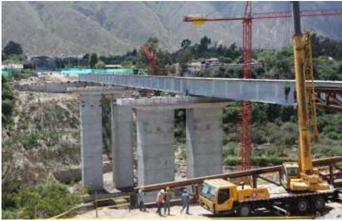
Foto: Construcción puente de Los Pájaros