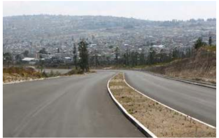
Prolongación de la Av. Simón Bolívar