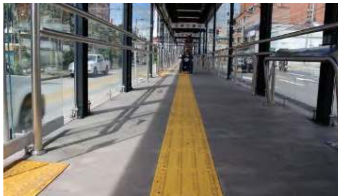
Foto: Parada remodelada con accesibilidad universal