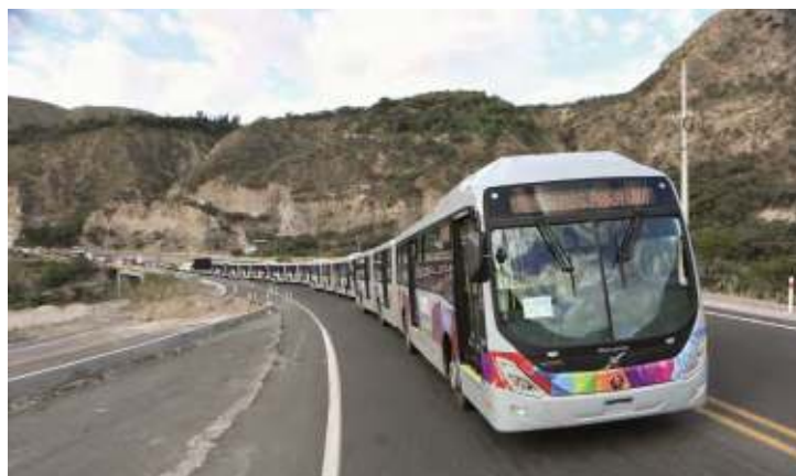
Foto: 80 nuevos biarticulados llegaron a Quito

Las estaciones también cuentan con cámaras de video vigilancia, conectadas al sistema ECU 911. Son ambientalmente amigables, con iluminación LED, con techos verdes y, además, tienen un tamaño más amplio para recibir a los 80 nuevos buses biarticulados, que ya se encuentran en nuestra ciudad, con capacidad para 250 personas; de tal forma de recibirlas y dar la atención de manera más cómoda, con mayor espacio y seguridad, reduciendo los índices altísimos de saturación que existían cuando iniciamos nuestra Administración Municipal. Todos los vehículos de este sistema han sido homologados por la Agencia Nacional de Tránsito, de acuerdo con las normas INEN del Gobierno Nacional.