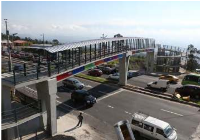
Foto: Puente peatonal Ruta Viva

De igual manera, hemos construido nuevos pasos peatonales con elementos como iluminación adecuada, rampas para personas con discapacidad y vamos a continuar construyendo este tipo de infraestructura, sobre todo en las principales arterias de los anillos viales, porque en cambio en las calles del hipercentro de la ciudad, de la zona más concentrada, lo que continuaremos haciendo es habilitando cruces seguros, que es lo que corresponde para la priorización del peatón.