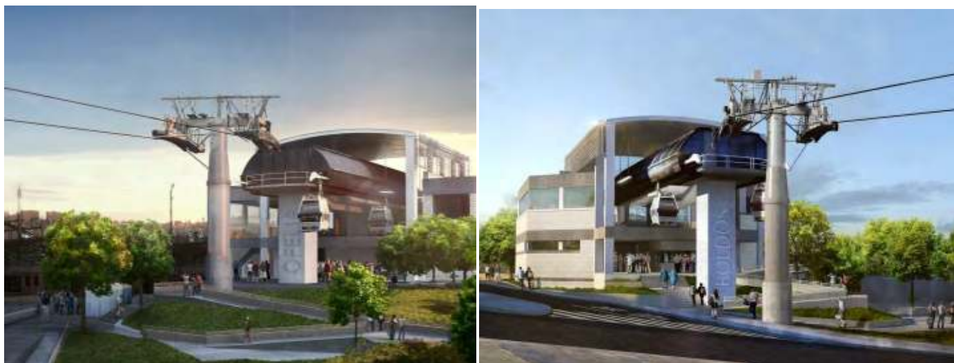
Fotos: Render estaciones Quito Cables en el noroccidente de Quito

El cuarto componente de nuestro sistema integrado del transporte público es el sistema Quito Cables. Uno de nuestros principales compromisos de campaña, por lo tanto una promesa que estamos cumpliendo, fue el brindar a la ciudad alternativas de transporte público en dirección este-oeste, que complementen las opciones en dirección norte-sur con las que ya cuenta el transporte público metropolitano como son: el Trolebús, la Ecovía, y más adelante El Metro. Justamente para cumplir este compromiso y conectar con eficiencia, de manera ágil, rápida, cómoda y segura a los barrios altos de la ciudad, en una zona topográficamente compleja, es que planteamos el proyecto Quito Cables, con la primera línea que conectará al sector de La Ofelia con La Roldós.