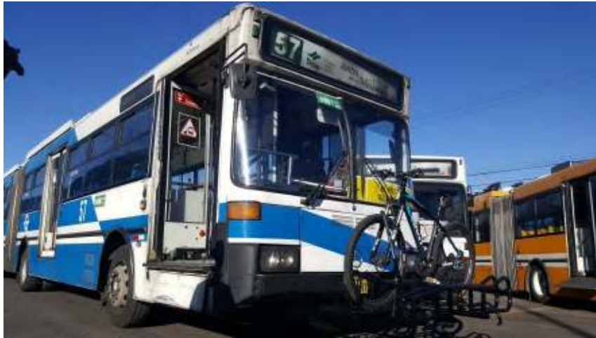
Foto: Portabicicletas en las unidades del Trolébus

Estamos muy optimistas respecto de lo que se está logrando en materia de fomento del uso de la bicicleta. Por supuesto, continuaremos con estos esfuerzos durante el próximo año.