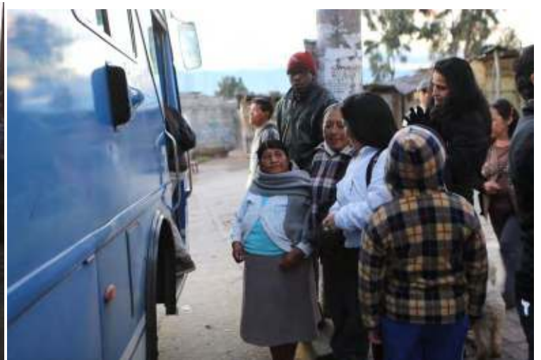
Fotos: Habitantes La Pisulí que utilizan el transporte público actualmente, largas filas y demora en recorridos

El viaje en las cabinas del sistema Quito Cables y la conexión con el Corredor Central Norte, es decir con el sistema de transporte público metropolitano, por 35 centavos, evidentemente es una tarifa social que se ajusta a las condiciones económicas de los sectores que pretendemos servir.