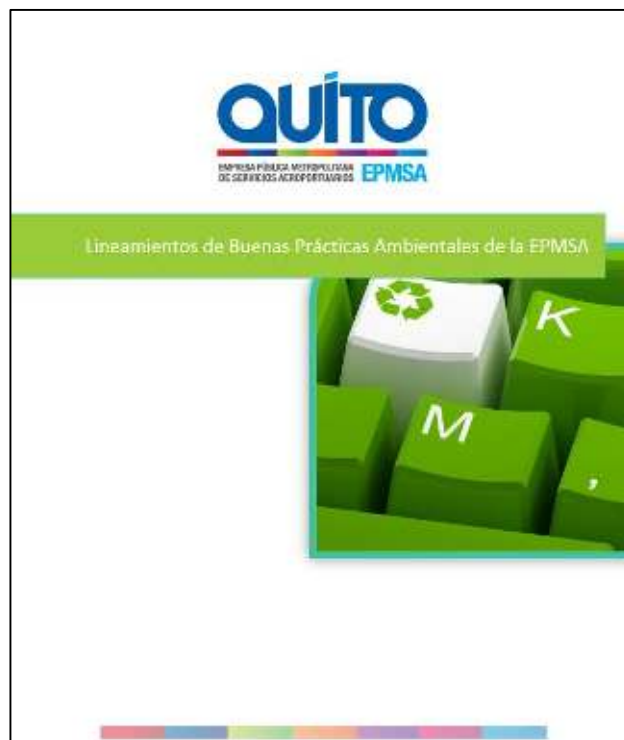
Gráfico 3.- Portada del Documento de Lineamientos de Buenas Prácticas Ambientales de la EPMSA