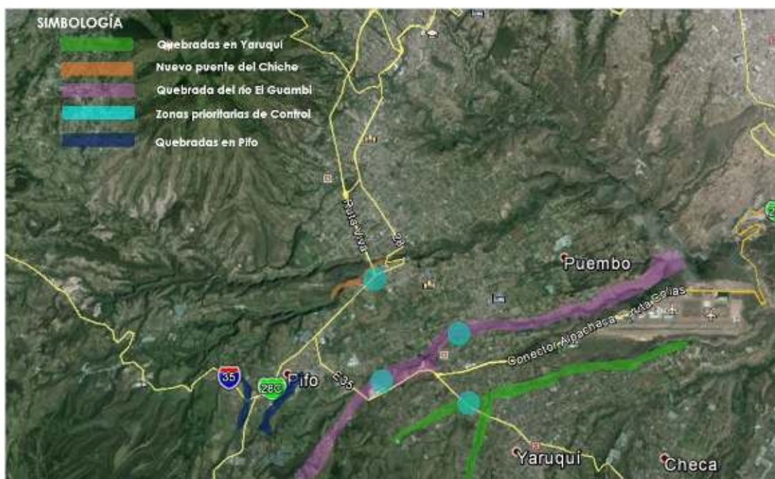
Gráfico 4.- Rutas para patrullaje de la Policía Metropolitana Ambiental