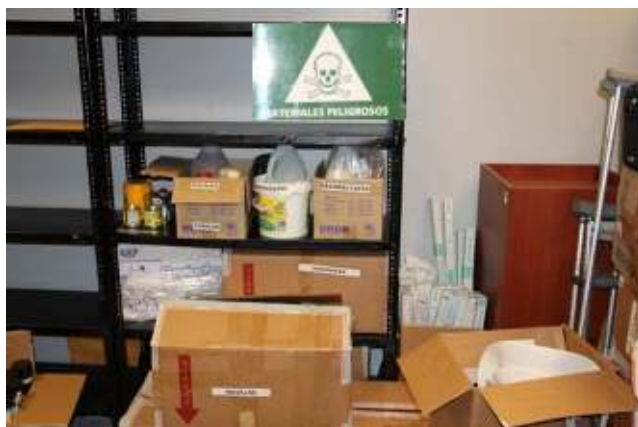
Fotografías del almacenamiento temporal de desechos peligrosos e infecciosos

Adicionalmente, la Dirección de Control Ambiental ha coordinado con la Gerencia de Seguridad y la Dirección Administrativa, el almacenamiento temporal y posterior entrega a un gestor autorizado de los desechos peligrosos e infecciosos acumulados en la bodega de objetos olvidados y en dispensario médico, respectivamente (ver fotografías).