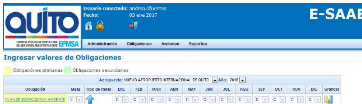
Gráfico 6.- Captura de pantalla Sistema E-SAAE

Se considera importante indicar, en función de la Disposición 14, que la Dirección de Control Ambiental creó en el sistema E-SAAE la obligación “PLAN DE INSPECCIONES AMBIENTE”, la cual permite medir el nivel de cumplimiento de las programaciones mensuales de inspecciones a las diferentes áreas del AIMS y a documentos técnicos, ya sean del Manual de Operaciones y Mantenimiento del aeropuerto como del Plan de Manejo Ambiental vigente. El seguimiento de dicha obligación se la efectúa a mes vencido, y para el año 2016 se tiene el siguiente resultado, obtenido de la captura de pantalla del sistema E-SAAE: