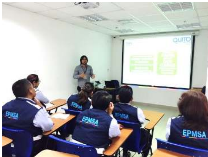
Fotografía de la charla de Gestión adecuada de residuos sólidos

Durante el año 2016, se impartió esta charla a 241 servidores de la EPMSA (ver fotografía).