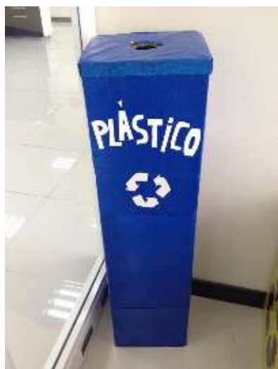
Fotografías de contenedores de residuos implantados en la EPMSA

Adicionalmente, la Dirección de Control Ambiental ha provisto a las áreas administrativas y a las áreas operativas de la Empresa, de contenedores de residuos reciclables y comunes (ver fotos).