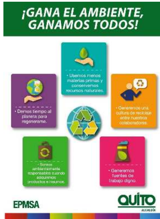
Gráfico 2.- Afiche informativo, gestión adecuada de residuos sólidos