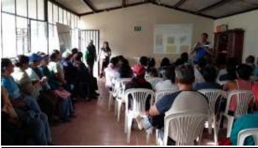
Barrio Chinangachí (Yaruquí)