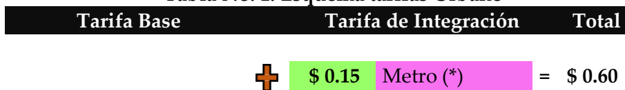
Tabla No. 1. Esquema tarifas Urbano

Este esquema está definido por una tarifa base para cada uno de los subsistemas (columna Tarifa Base) y un valor adicional menor por la integración a los mismos (columna Tarifa de Integración). El esquema de tarifas se describe en las tablas Nos. 1 y 2 y será implementado conforme se vayan integrando cada uno de los subsistemas.