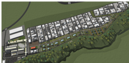
Implantación general. Elaborado por: Escuela Politécnica Nacional

Los insumos generados por el equipo consultor son fundamentales para la aprobación de la Ordenanza Metropolitana que permitirá regular el uso y ocupación de suelo y establecer los parámetros urbanísticos aplicables a la ZEDE-QUITO. Así mismo, permitirá al Municipio priorizar las obras de infraestructura necesarias para el desarrollo de la ZEDE-QUITO.